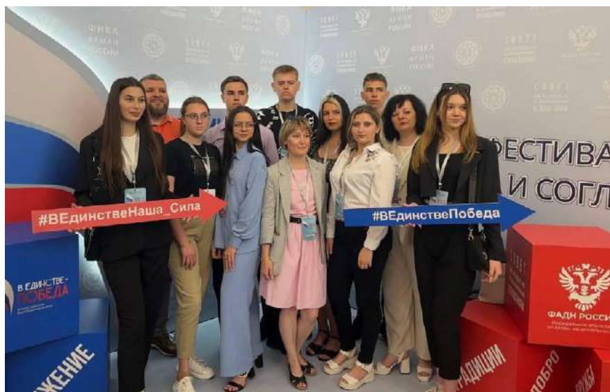
Фестиваль «В единстве — Победа» [В єдності — Перемога], м. Геленджик 251