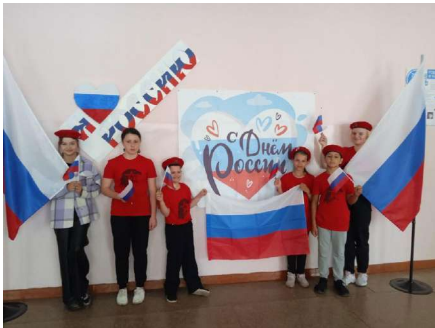
День Росії в Широковській школі т.о.т. Херсонської області 190

Дню Росії присвячувалися і спортивні заходи: у т.о. Новотроїцьку відбулися змагання із рукопашного бою, 191 матч з футболу, 192 турніри з боксу 193 і стрітболу. 194 У Тавричанській школі до Дня Росії провели низку спортивних заходів. 195 14 червня «відділ молодіжної політики та спорту» організував змагання зі стрітболу. 196