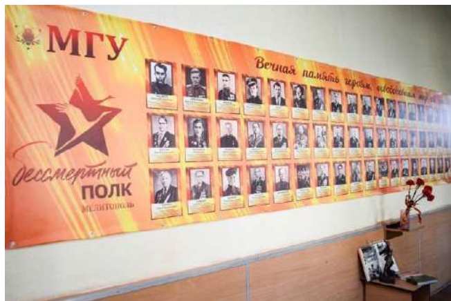
Акція «Безсмертний полк» 165

[Стіна пам'яті]. 163 Також було відкрито стелу Вічної слави співробітникам і студентам навчального закладу, котрі добровільно пішли на фронт під час ВВВ. 164