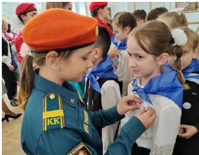
Посвята в орлята в школах №23, 28, 29, 41, 58, Інженерній школі, гімназіях №5 і №24 т.о. м. Севастополь. 76