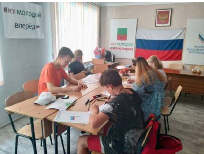
Активісти «#ЮгМолодой» [«#Південь-Молодий»] міста Дніпродзержинськ пишуть листи російським військовикам. 282