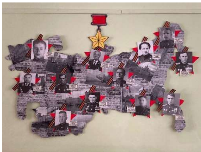
«Стена памяти» [Стіна пам'яті]. 166