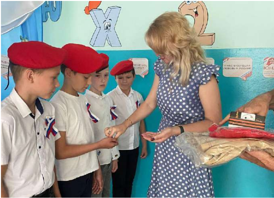
Посвята в т. о. Краснянську 316