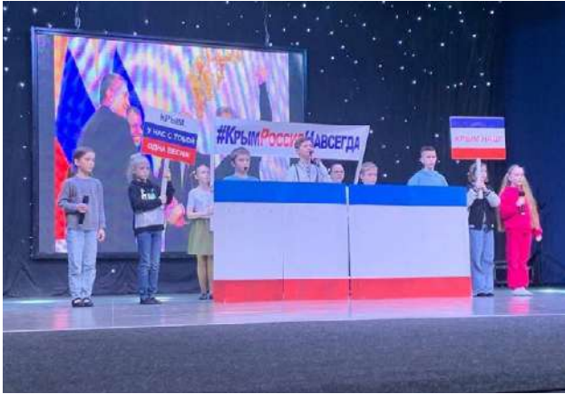
Конкурс «Мы – НАСЛЕДНИКИ ПОБЕДЫ!» [МИ – СПАДКОЕМЦІ ПЕРЕМОГИ] 61

У т.о. Сімферополі пройшов фінал зонального етапу творчого конкурсу «Мы – НАСЛЕДНИКИ ПОБЕДЫ!» [МИ – СПАДКОЕМЦІ ПЕРЕМОГИ] серед учнів шкіл, на республіканському етапі конкурсу виступатимуть колективи МБОУ ЗШДС «Лінгвіст» та МБОУ ЗШДС №15. Метою конкурсу є «навернення підростаючого покоління до духовних цінностей та історії Вітчизни (тобто Російської Федерації, – уклад.), виховання патріотизму, поваги до подвигу старшого покоління». 60