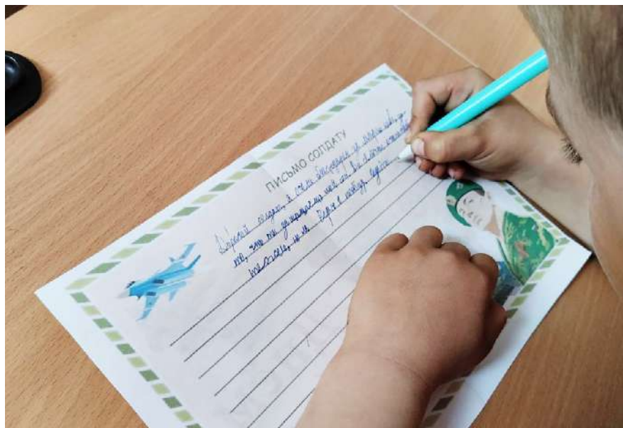
ДКЗ ЗО «Коларівська ЗОШ» Бердянського району. 281