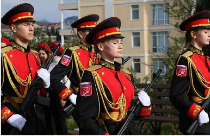
Посвята в Юнармію в т.о. Судаку 108

15 квітня у т.о. м. Сімферополі юнармійці поклали квіти на честь 79-ї річниці визволення міста від німецько-фашистських загарбників. Декількох дітей нагородили відомчими нагородами Юнармейская доблесть 3-й степени. 109