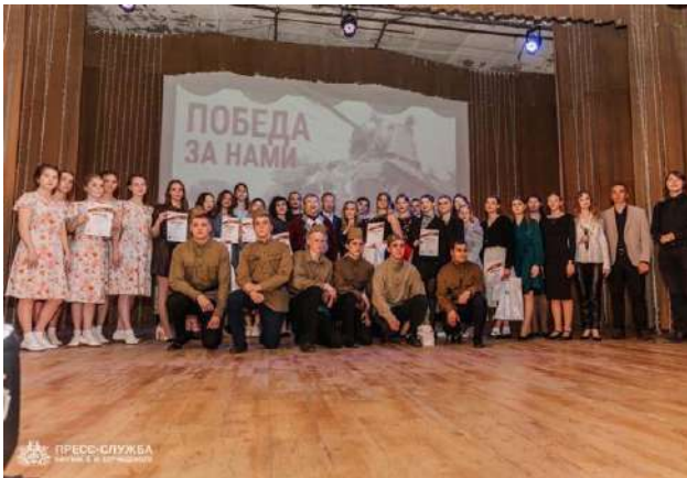
Конкурс «Победа за нами» [Перемога за нами] у КФУ, 13 квітня 62