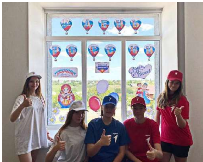
«Добро. Конференция» [Добро. Конференция] (в Самаре з 5 по 10 червня) 250