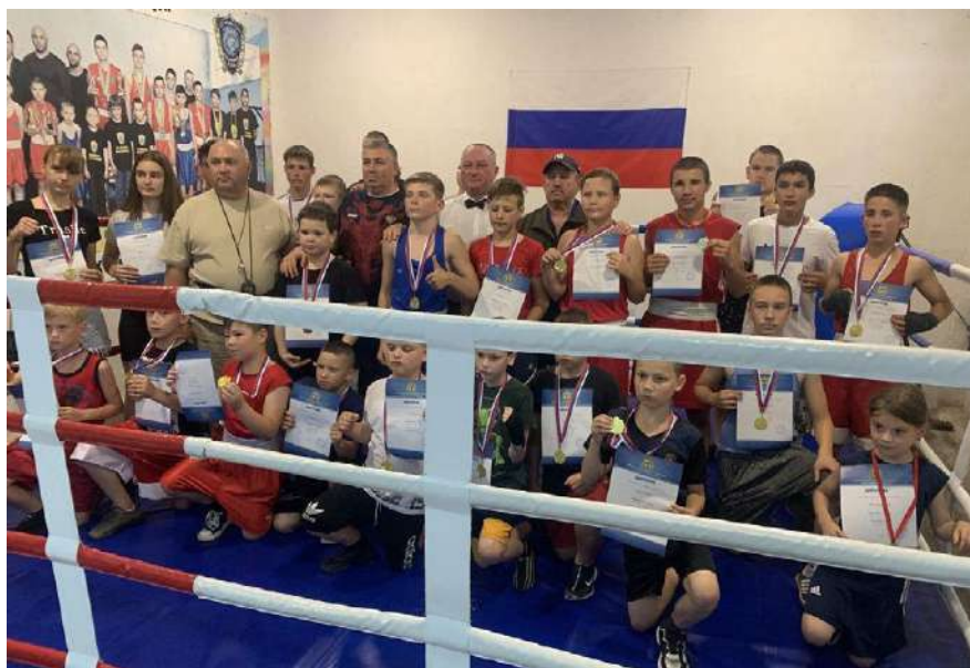
Турнір з боксу в т.о. Новотроїцьку 198