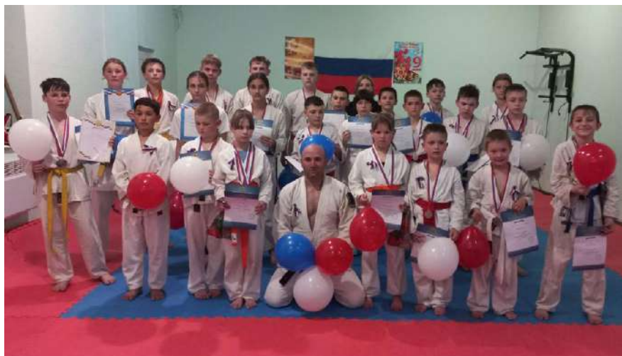
Змагання з рукопашного бою у т.о. Новотроїцьку 197