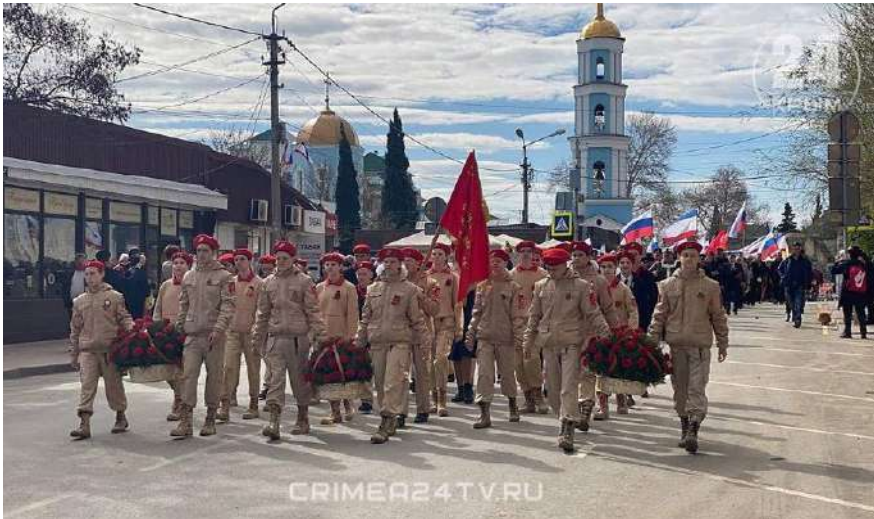
Парад юнарімійців у Бахчисараї пройшов від «Алеї Слави» до Пам'ятника «Загиблим партизанам» 53

У рамках Всеросійської акції «Помним и рассказываем» [Пам'ятаємо та розповідаємо] учасники «Движения первых» [Руху перших] зачитували вірші та публікували відеовиступи на своїх сторінках у соцмережах з хештегами руху на пам'ять загиблих через «геноцид радянського народу в роки Великої Вітчизняної війни». 54 Відбулася також акція «Сады Победы» [Сади Перемоги] від «Движения Первых» [Руху перших], що передбачає висадження 27 мільйонів дерев на «згадку про кожного, хто загинув у роки ВВВ». 55