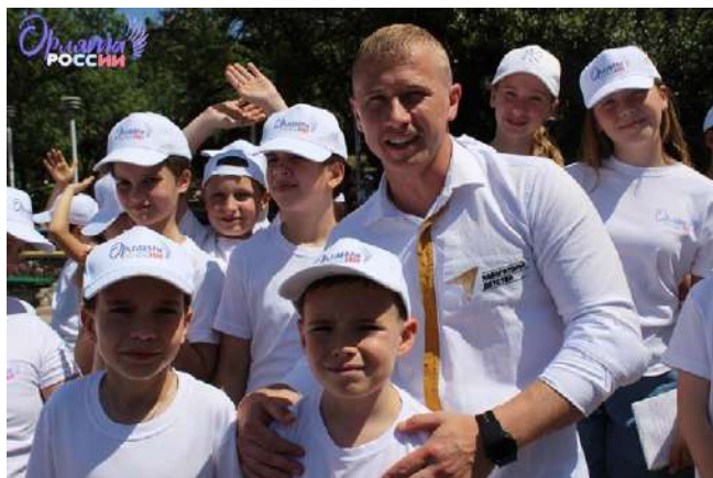
Відкриття тематичної зміни «Орлята Росії» в ДЮСШ «Ласпі», де взяли участь близько 200 дітей. 77