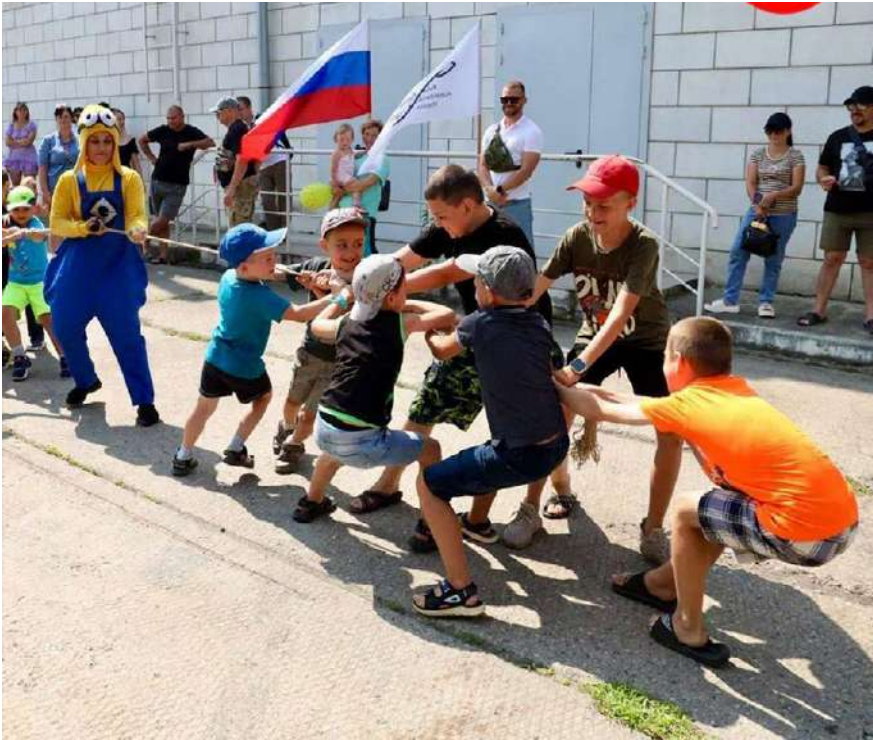
Дитяче свято у т.о. Мелітополі, організоване «Молодой Гвардией» [Молодою Гвардією] 274

Організація також активно сприяє насадженню російської ідентичності через неформальні заходи, де активно використовується російська символіка.