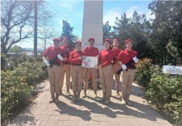
Юнарміїці загону «Сокіл» МБОЗ «Гімназія ім. Н. Р. Андрєєва» 106

19 квітня розпочався весняний етап «Вахты памяти поколений – “Пост № 1”» [Вахты пам'яті поколінь – «Пост №1»], в якому активну участь взяли члени юнармії т. о. Криму. Чергування дітей відбувалось під час навчального процесу. Також пройшли урочисті посвяти до лав Юнармії.