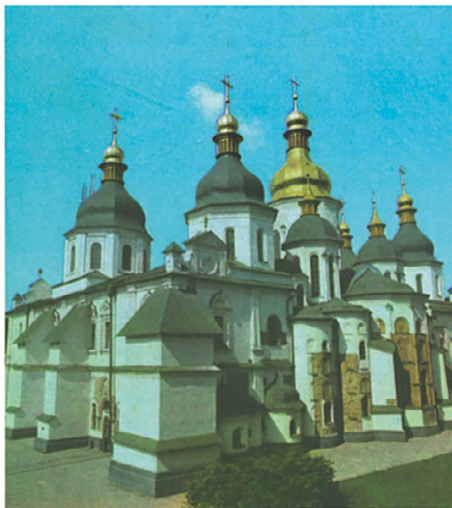
Софийский собор в Киеве. XI в.