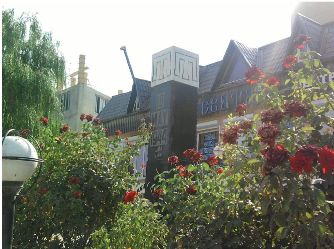
Монумент в Судаку