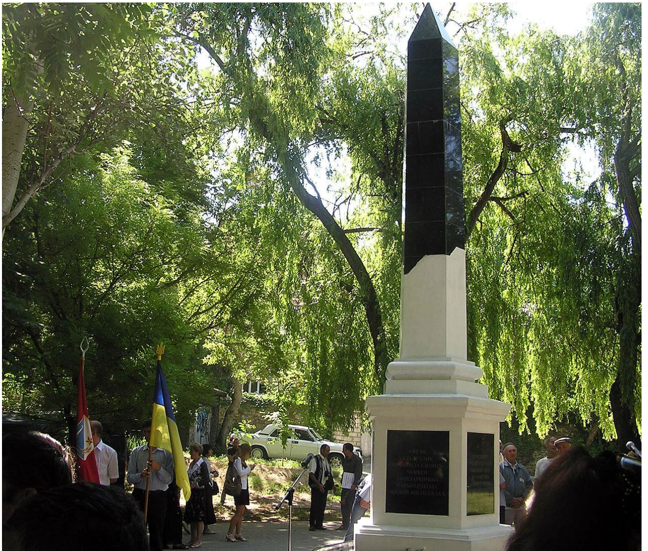
Пам'ятний знак у Севастополі