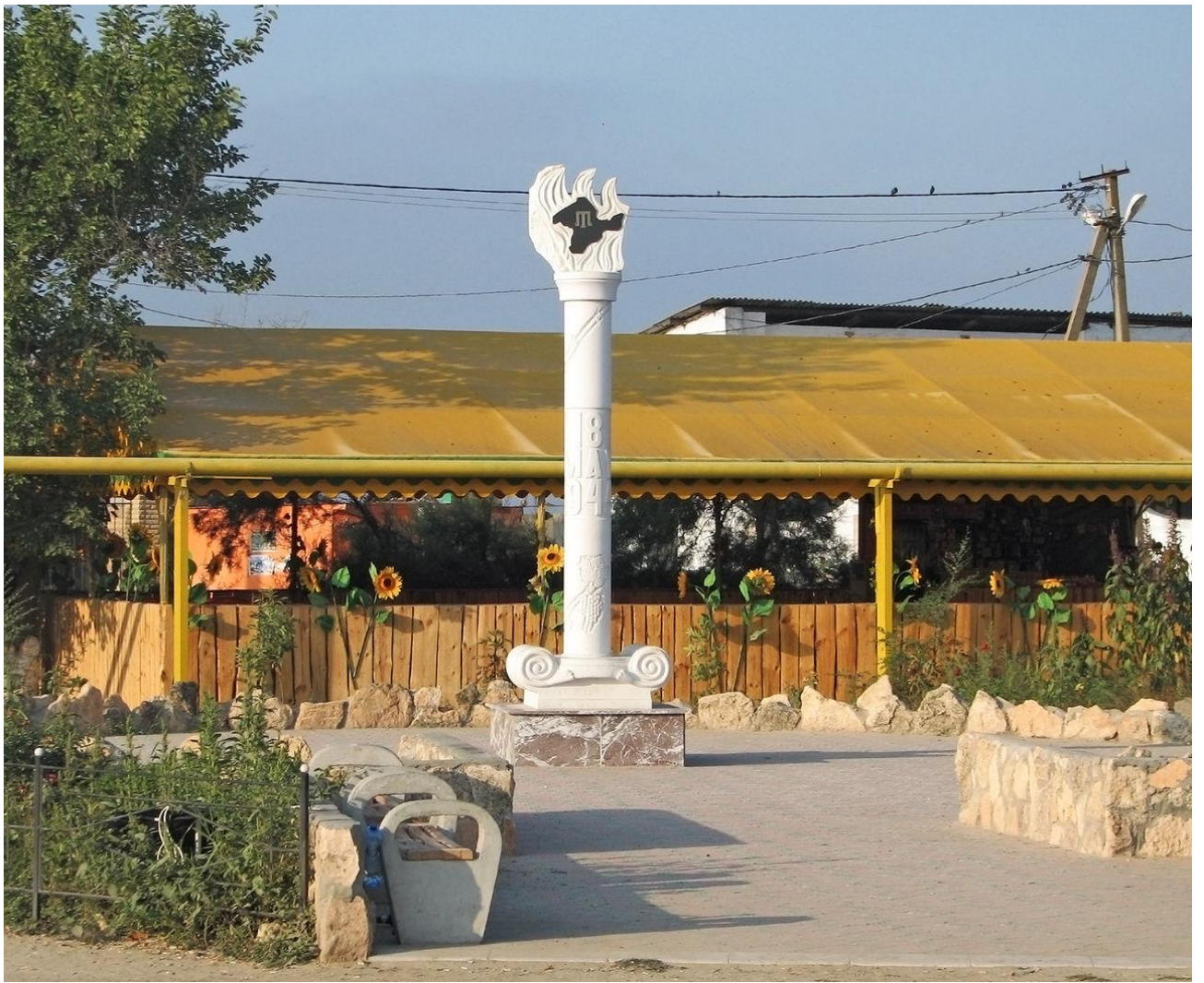
Пам'ятний знак жертвам депортації уМіжводному (до 1944 — Ярилгач)